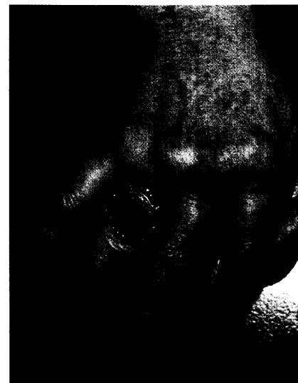
Seit Juni ist der selektive Costimulations-Blocker Abatacept zur Behandlung von Patienten mit rheumatoider Arthritis auf dem Markt. Seite 24