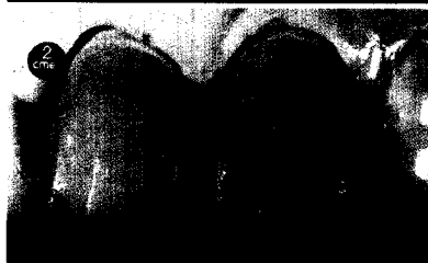
Dental Design: Keramikveneers Seite 314