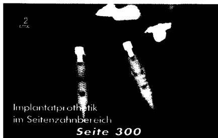
Implantatprothetik im Seitenzahnbereich Seite 300