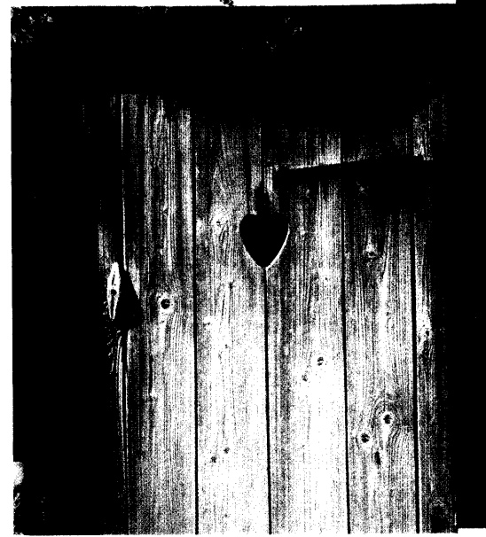
Eine Toilette immer in der Nähe: Ein Muss für schätzungsweise fünf Millionen Reizdarm-Patienten in Deutschland. Seite 24