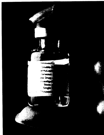
Die Pharmaindustrie will Kosten und Nutzen von Arzneimitteln unter die Lupe nehmen, allerdings erst nach der Markteinführung. Seite 6