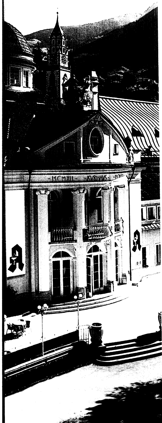
Herzerkrankungen, Hormontherapie, die Bewertung von Arzneistoffen und Pharmakoökonomie: Der 45. Fortbildungskongress in Meran. Seite 24