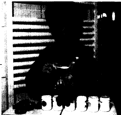
Atopie besser bewältigen