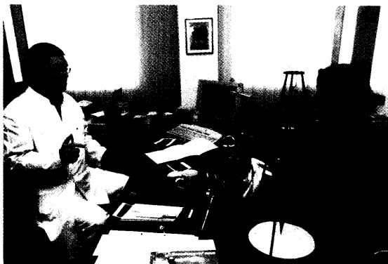
IGeL anbieten, nicht andrehen Die richtige Gesprächstaktik spielt eine entscheidende Rolle für erfolgreiches IGeL.