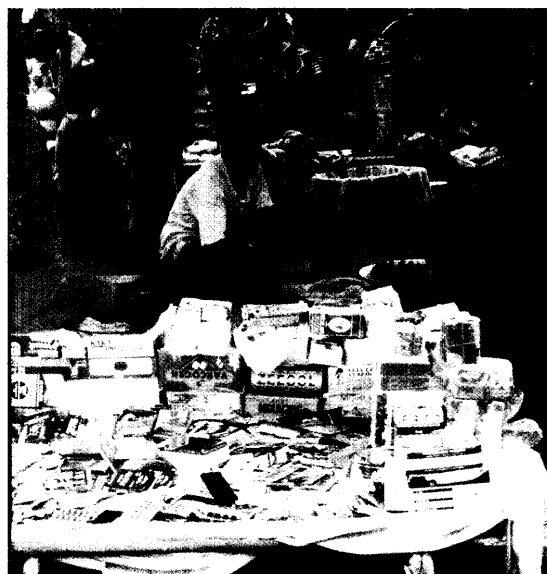
Billige Fälschungen statt wirksamer Medikamente. Seite 6