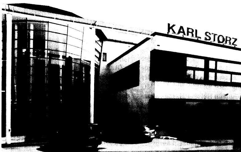
Das Logistik- und Schulungszentrum von Karl Storz in Tuttlingen.