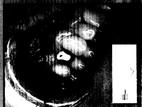
Einzelimplantat plus Zirkonoxid