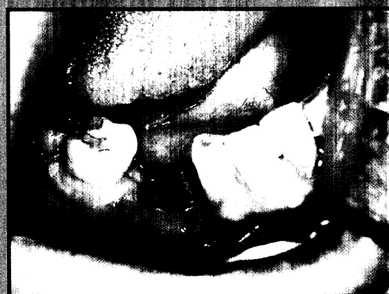
Langzeitergebnisse nach Frühbelastung