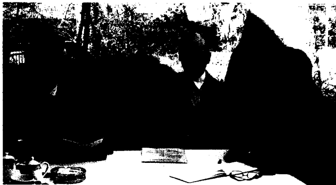
Wie Rundfunkwerbung der ganzen Laborbranche helfen kann, erfahren Sie in unserem Bericht über die DeguDent-Aktion ab Seite 636