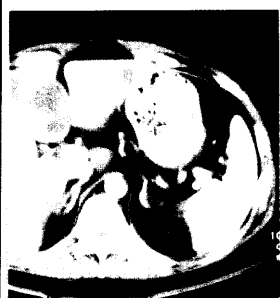
Computertomographie des Abdomens: Was sehen Sie?