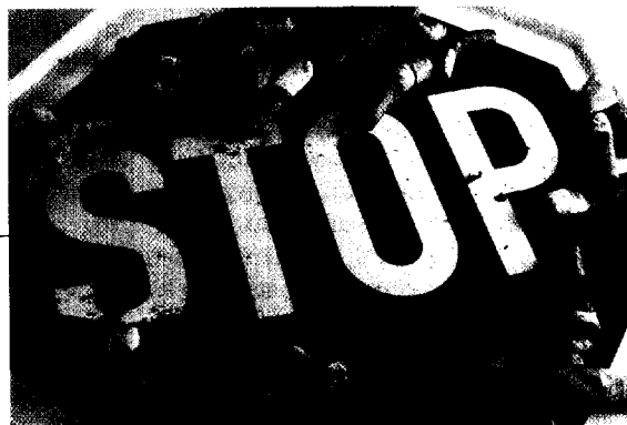
Igeln: Bieten Sie Ihren Patienten ein Rauchfrei-Programm an