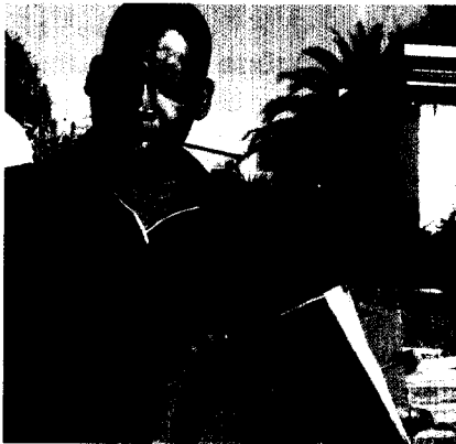
SEITE 42 In Lesotho hinterlassen Aidskranke ihren Angehörigen Erinnerungsbücher