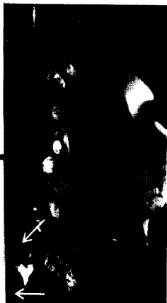
MRT des Epigastriums.