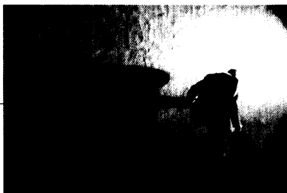
Demenz und Depression waren wichtige Themen beim VIII. Kongress der DGGPP in Mannheim