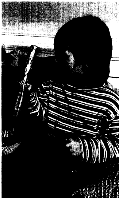
Musiktherapie gilt als spezielle Form der therapeutischen Behandlung von Kindern und Jugendlichen unter gezielter Anwendung des künstlerisch-kreativen Mediums Musik. Seite 19.