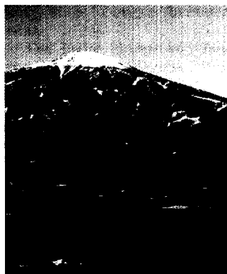
Klinikareal Innsbruck, im Hintergrund der Patscherkofel

10 Jahre Kardiologie Innsbruck Innsbruck, 9. bis 10. März 2007