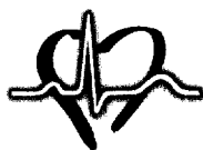
Abteilung Kardiologie Universitätsklinik für Innere Medizin Innsbruck