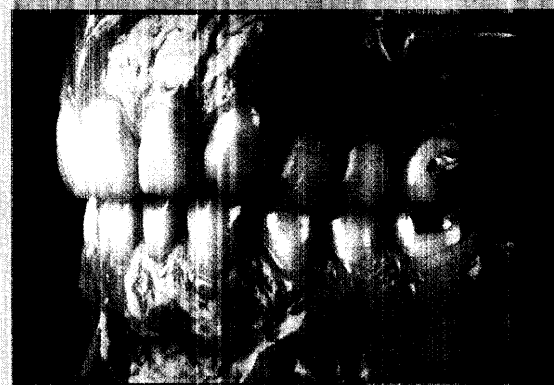
Preisträger des KunstZahnWerk-Wettbewerbs