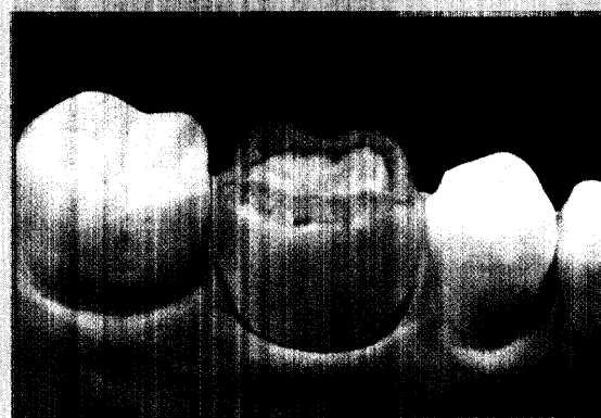
CAO – Computer Aided Overpress