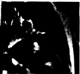
Bronchialkarzinom im rechten Lungenoberlappen.