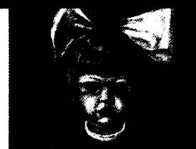
Otto Dix Nelly mit Spielzeug (1925) Bildbetrachtung auf Seite 120 dieser Ausgabe