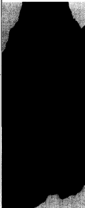
Titelbildvorlage: 64-Zeilen-MDCT (s. dieses Heft S. 754).