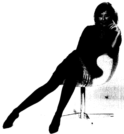
Jutta Speidel wirbt für die Branche.