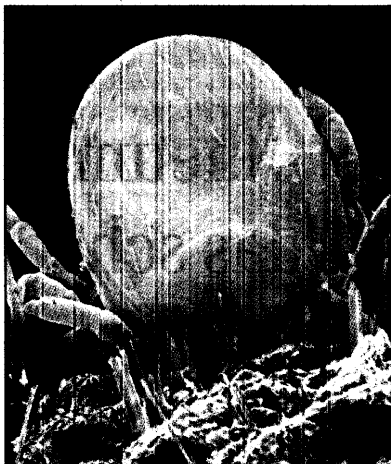
Zecke bei der Blutmahlzeit: Je länger

Das Risiko für FSME (FSME) nach Zeckenstich in Risikogebieten ist daher dringend empfohlen, die Zeit günstig zu impfen, die Patienten mit FSME wollen, sagt Süss aus Jena.