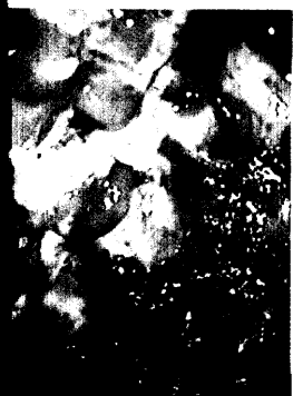
Ileokoloskopie: Ulzerationen im Kolon descendens im Sinne einer ischämischen Colitis.