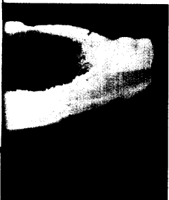
Makroskopischer Befund des Operationspräparates: verdickte, grau-weißliche Wand mit belegter Serosa und intakter Mukosa.