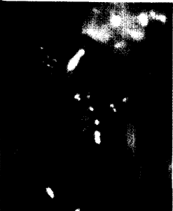
Blutungszeichen bei Ulkus.