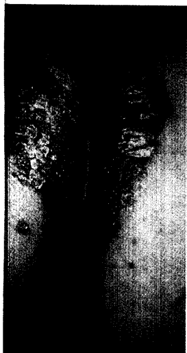
Psoriasisplaque im Sakralbereich.