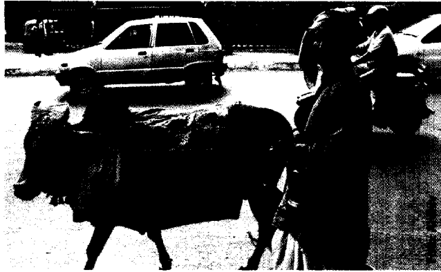
Die Krankenhausfinanzierung ist keine heilige Kuh; (186 ff.)