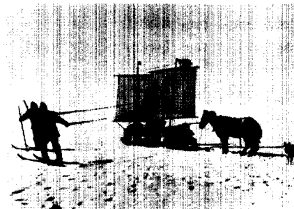
Überquerung Grönlands mit Islandponys, 1913.

Cornelia Lüdecke Der Meteorologe Alfred Wegener – Vor 100 Jahren führte Alfred Wegener die Aerologie in die Polarforschung ein . . . . . 125 Mit dem Namen Alfred Wegener verbindet man vor allem die Theorie der Kontinentaldrift, doch lag sein Forschungsschwerpunkt primär auf der Meteorologie. Wir erinnern an Wegeners meteorologische Messungen auf Grönland, die er vor 100 Jahren aufnahm und bis zuletzt mit hohem Einsatz verfolgte.