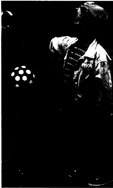
Mehr körperliche Aktivität im Kindesalter: Um dieses Ziel zu erreichen, ist es zentral, dem natürlichen Bewegungsdrang freien Lauf lassen. Seite 6