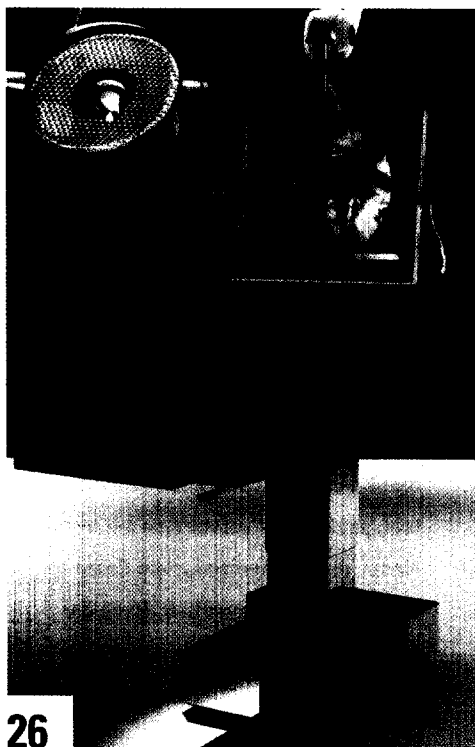
26 Der OP muss steril sein. Und sollte digital sein. Zumindest, wenn die Klinik auf Effizienz setzt