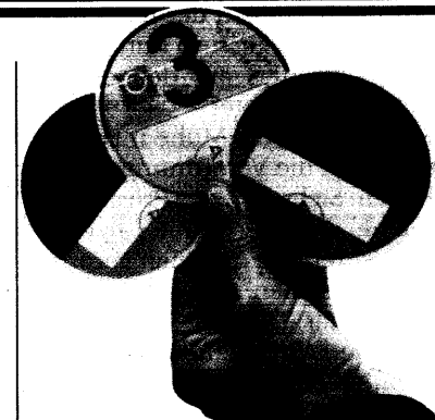
Rot, gelb oder grün – die Plaketten werden anzeigen, ob ein Pkw in Umweltzonen fahren darf.