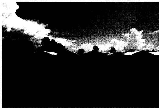
Tuberkuloseklinik mit HIV-Station in Norduganda.