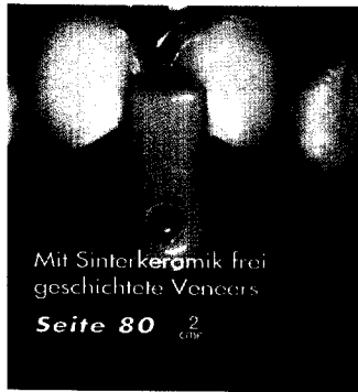
Mit Sinterkeramik frei geschichtete Veneers Seite 80