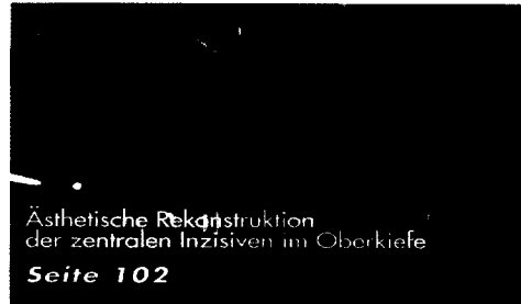
Ästhetische Rekonstruktion der zentralen Inzisiven im Oberkiefer Seite 102