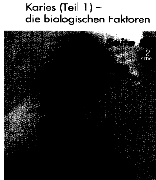
Karies (Teil 1) – die biologischen Faktoren