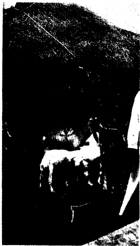
Im Jahr 2000 kam es zum letzten großen Ausbruch des Rift-Valley-Fiebers im Jemen und in Saudiarabien.