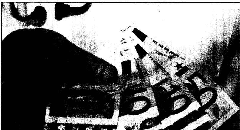
Kaum zu glauben, aber wahr: Ärzte verzichten freiwillig auf Umsatz.

(u). Viele Kollegen nach Einschätzen bei ihrer Geld. Doch Änderungen Ärzte bis zu Beträge mehr im tzt der Allgegang Frimmel