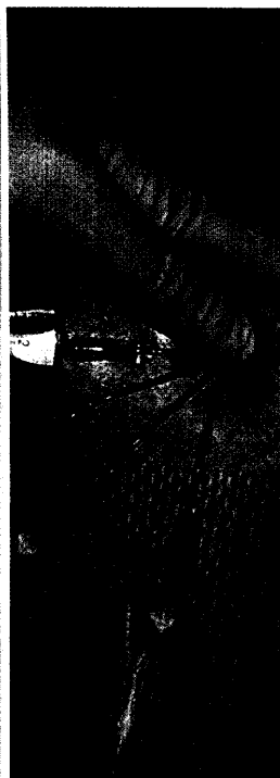
Titelbildvorlage: Punktion der rechten Vena subclavia (s. dieses Heft S. 328).