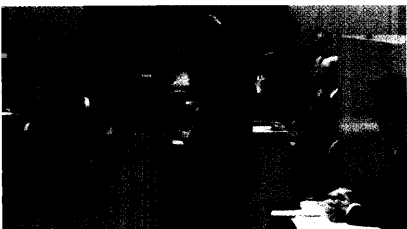
Klares Votum für die Gesundheitsreform: Angela Merkel hat den Bundesrat im Griff. Seite 8

Gesundheitsreform: Bundesrat macht keinen Ärger