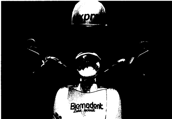
Rasant entwickelte sich die Biomadent Zahntechnik in Eberswalde – vor allem durch CAD/CAM. Wir unterhielten uns mit den Laborchefs . Ab Seite 120