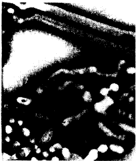
Transmissionselektronen- mikroskopische Aufnahme: Influenza A-Virus.