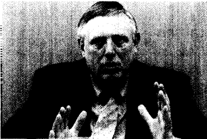
Karl-Josef Laumann: »Die Apotheker sollten sehr selbstbewusst mit ihren Dienstleistungen umgehen.«

»Im Gesundheitswesen kommt es auf das richtige Maß Wettbewerb an« / Interview