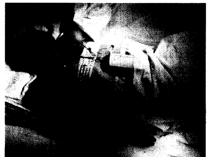
Neue Technologien könnten den Besuch im Schlaflabor bald überflüssig machen.

Hospitalia verschmilzt mit dem Zentraleinkauf 44