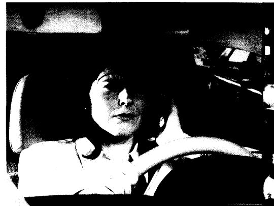
Vor allem Frauen der rund 12 Millionen Migränepatienten in Deutschland werden von attackenartig auftretenden, einseitigen Kopfschmerzen gequält. Seit etwa einem Jahr steht ein Triptan rezeptfrei zur Verfügung. Seite 24