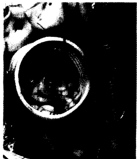
Aortenklappenrekonstruktion nach David.