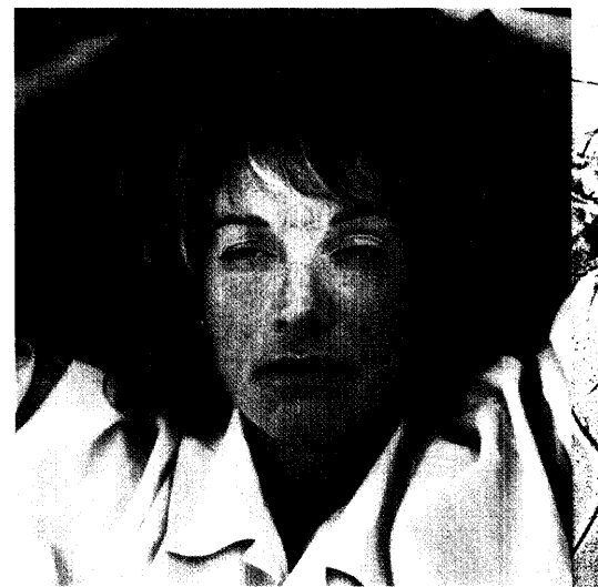
Schlaflosigkeit aufgrund der »ruhlosen« Beine ist eines der quälenden Symptome des Restless-Legs-Syndroms. Kürzlich sind zwei Dopaminagonisten aus der Parkinsontherapie für diese Indikation zugelassen worden. Seite 20