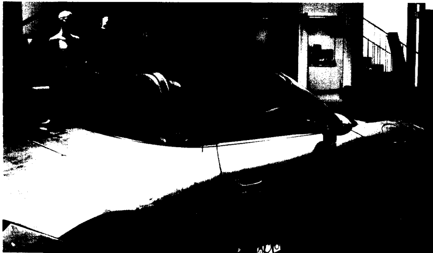
Goldene Zeiten: Eine Veranstaltung der Firma C.Hafner führte auch in die Schmuckwelten in Pforzheim. Ab Seite 10