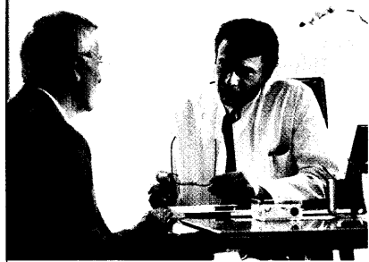
Vielen Medizinern fehlen die notwendigen Informationen. Seite 8

Rabattverträge: Verwirrspiel um die Versorgung mit kurzwirksamen Insulinanaloga