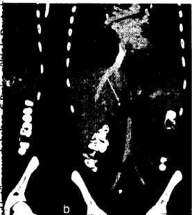
Thrombose der Femoral- sowie Beckenvenen und der VCI aufgrund einer KAVCI.