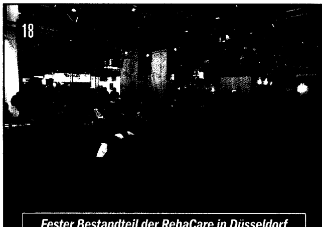
Fester Bestandteil der RehaCare in Düsseldorf ist das Forum „Treffpunkt Gehirn“, die Kommunikationsplattform für hirnerkrankte Menschen.