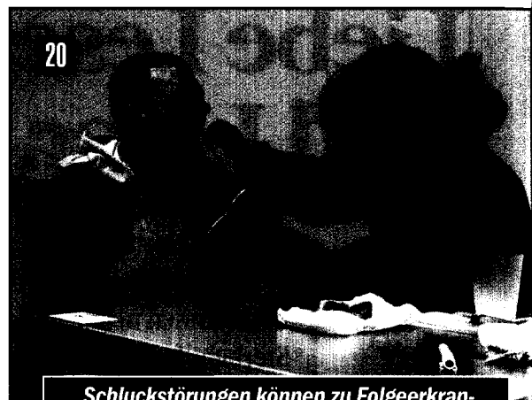
Schluckstörungen können zu Folgeerkrankungen führen. Daher muss eine individuelle Dysphagiebehandlung eingeleitet werden.