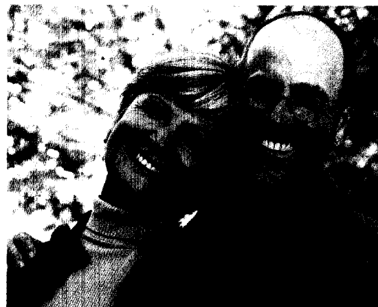
Seite 149 Ältere Menschen benötigen für einige Infektionen eine Aufrisch-Impfung. Wichtig ist auch die Impfung gegen Influenza im Herbst