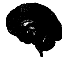
35_ Studie: Sexualhormone und kognitive Leistungen