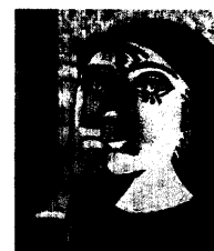
Titelbild: Impression nach P. Picasso