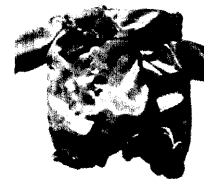
7_ Sekundäres Geschlechterverhältnis in Krisenzeiten